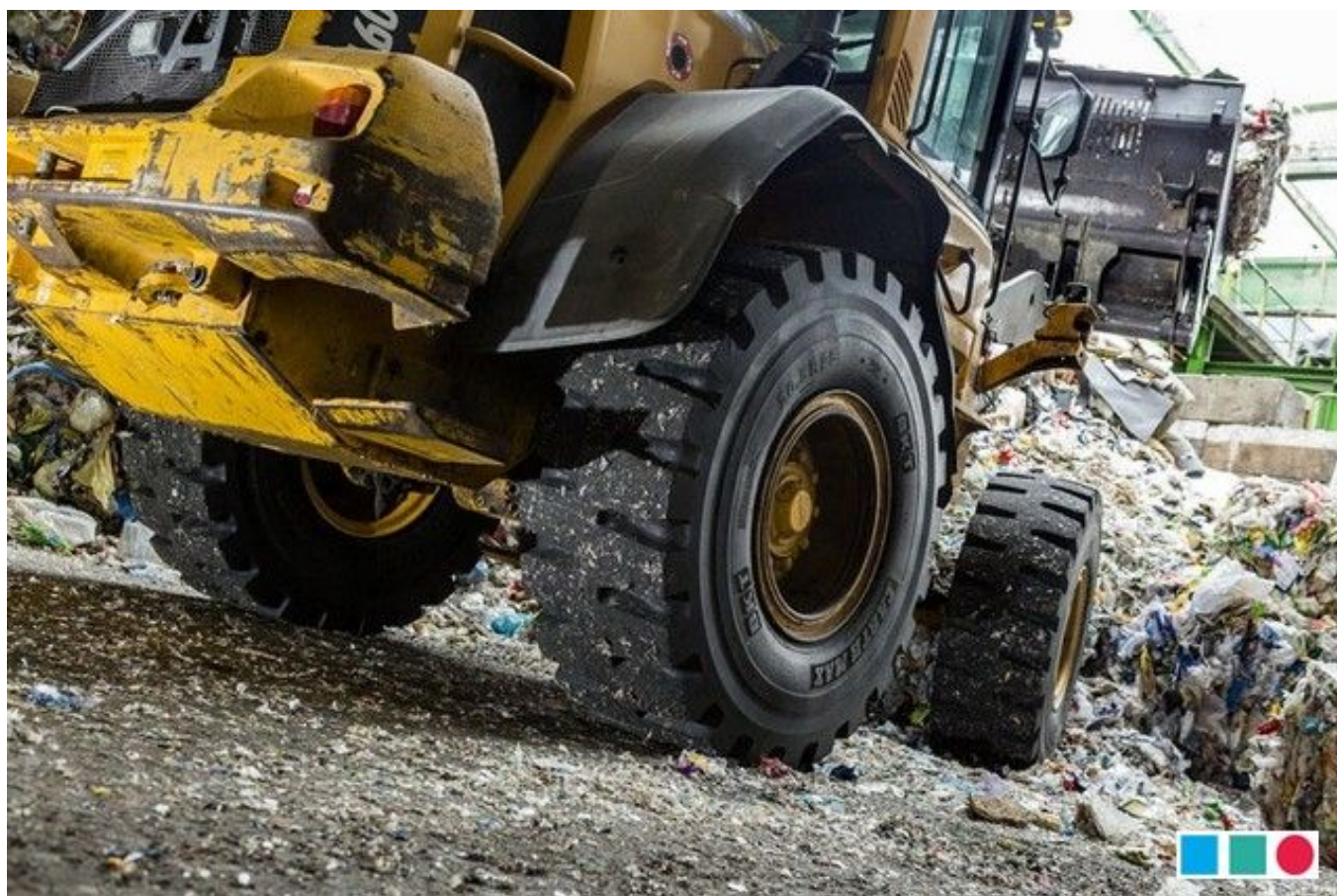
Шины VKT Earthmax SR 53: высокая тяговая способность в сложных условиях.